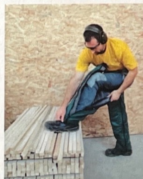
2 Beinlinge mit Reissverschluss