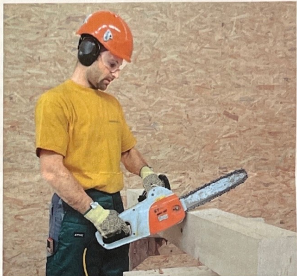
1 Für die Arbeit entsprechende Schutzausrüstung tragen

Arbeiten mit der Kettensäge nur mit entsprechender Ausbildung und der Persönlichen Schutzausrüstung!